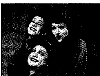
Le sorelle Marinetti

Sull'onda lunga e lontana delle deliziose Sorelle Bandiera di arboriana memoria, sulle tracce di celebri gruppi vocali del passato, dalle classiche Bo-