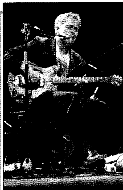
Marc Ribot, collaboratore storico di Tom Waits